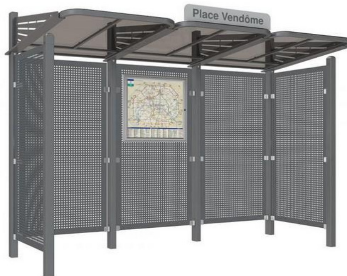
Abri bus CONVIVAL - Tout en acier