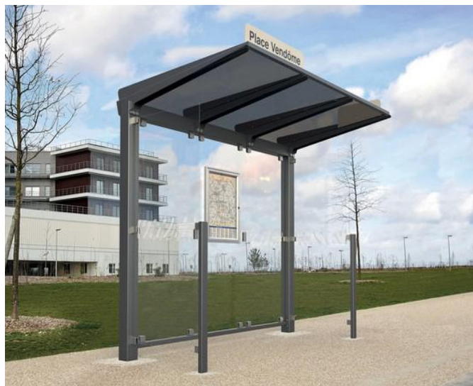
Abri bus VENISE