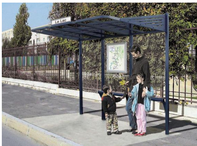
Abri bus convivial