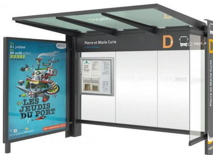
Abri bus KUB