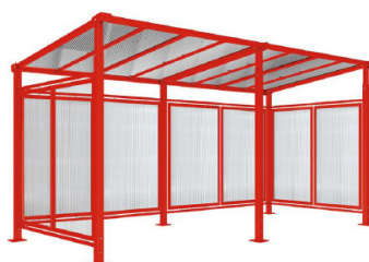
RAL 3020 - Extension