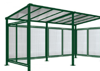
RAL 6005 - Extension