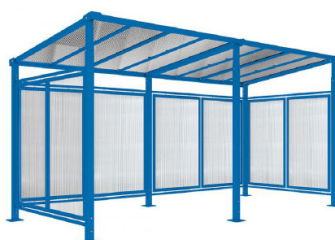
RAL 5010 - Extension