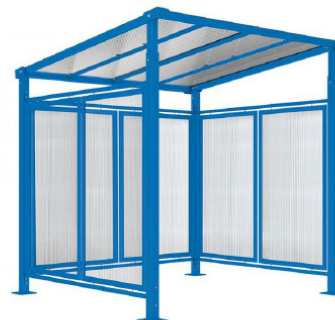
RAL 5010 - Initial