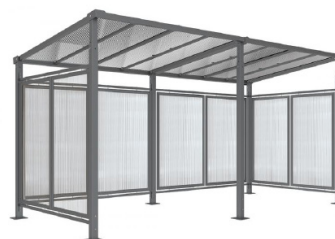
RAL 7044 - Extension