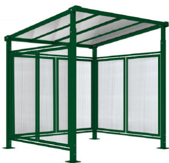
RAL 6005 - Initial