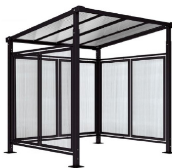
RAL 9005 - Initial