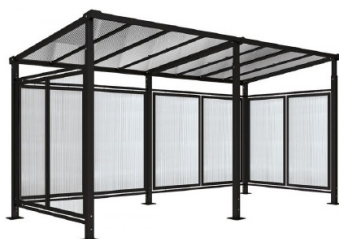
RAL 9005 - Extension