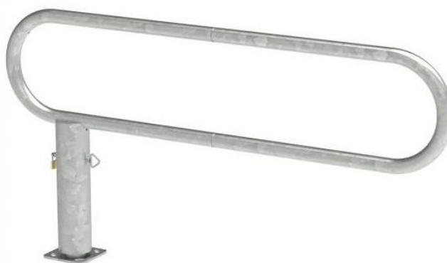
Barrière tournante 2 mètres