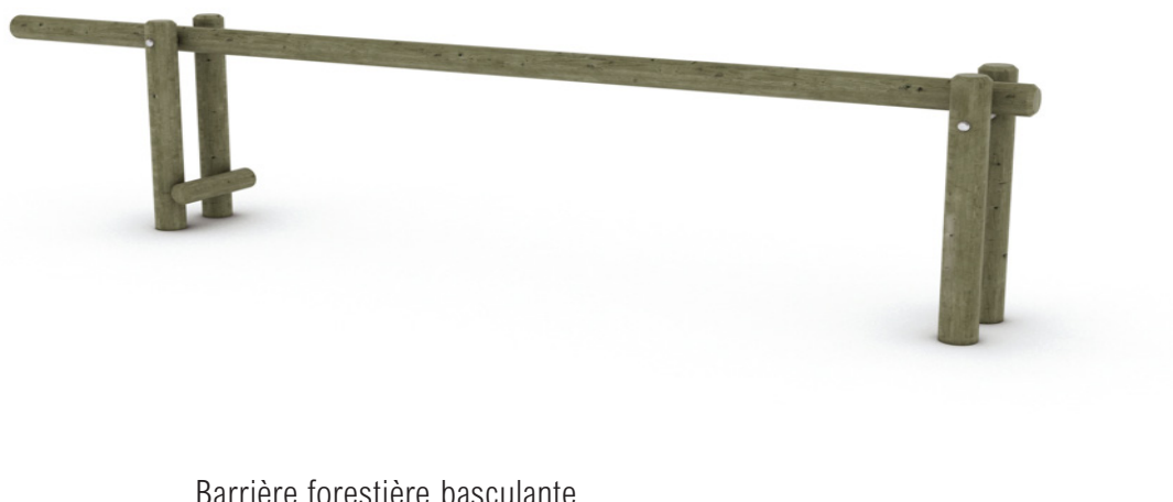
Barrière forestière basculante