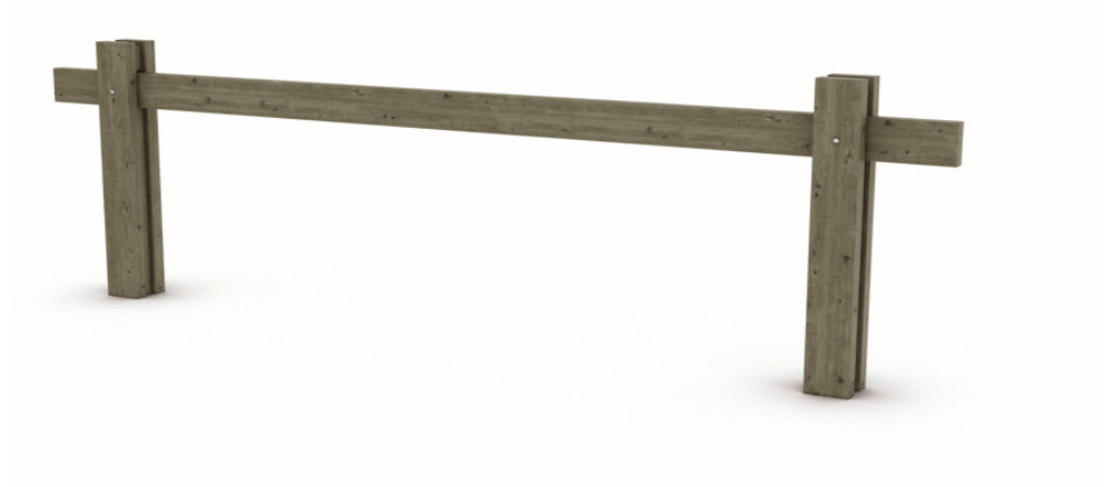
Barrière forestière coulissante