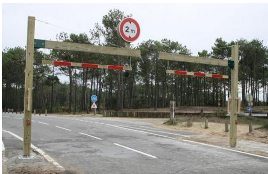
Portique tournant acier/bois