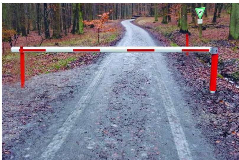
Barrière pivotante pour terrain accidenté