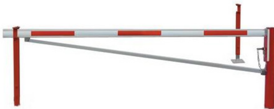
Barrière tournante standard - à sceller